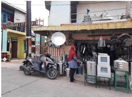
Gambar 1. Lokasi Pengabdian

wajan, pemanggang, cerobong berbahan dasar plat aluminium, dsb. Namun barang lain seperti oven listrik ukuran besar untuk keperluan industri merupakan barang yang dipasok oleh produsen lain dan dijual di UMKM tersebut. Dilihat dari kepemilikan, UMKM ini pada umumnya diwariskan secara turun-temurun dari orang tua ke anaknya. Namun masih terdapat juga penjual dengan usia yang cukup lanjut masih memimpin sendiri aktivitas jual beli.