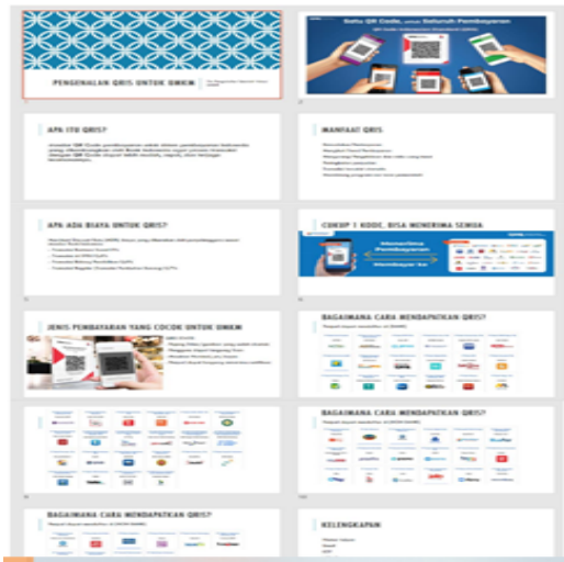
Gambar 2 Modul Pengenalan QRIS

Tim memilih menggunakan aplikasi dompet digital dan tidak menggunakan tata cara pendaftaran dari Bank karena pemilik UMKM memiliki rekening bank yang berbeda-beda sehingga kebijakan pendaftaran QRIS pun akan berbeda-beda.