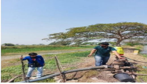
Gambar 5. Sosialisasi dan Pengecekan Mesin Diesel ke Tambak Desa Tirem