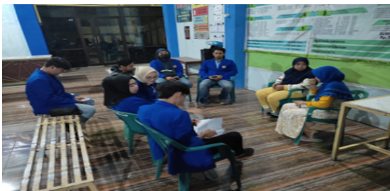
Gambar 3. Perizinan KKN kepada Perangkat Desa