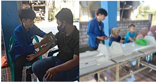
Gambar 6. Posyandu Anak dan Lansia

Posyandu yang dilaksanakan pada tanggal 14 juli 2023. Posyandu ibu-ibu lansia dan anak yang ada di desa Tirem bersama dengan ibu perangkat desa. Program yang dijalankan posyandu seperti menanyakan keluhan, mengecek tekanan darah, dan mengecek gula darah. Sedangkan Untuk posyandu anak dengan kegiatan menimbang berat badan anak, mengukur tinggi badan, dan memberikan pengarahan tentang pemilihan makanan untuk anak yang bernutrisi dengan tujuan Supaya masyarakat desa tirem bisa terkontrol kesehatannya dengan baik di kalangan usia.