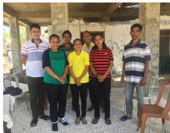
Gambar 2. Dokumentasi bersama Majelis Jemaat

Dalam kasus Jemaat Semau Utara, implementasi pelatihan yang mengedepankan keterlibatan aktif melalui pembagian kelompok untuk merancang ibadah dapat dianggap sebagai langkah positif. Ini tidak hanya meningkatkan kualitas pesan yang disampaikan dalam khotbah, tetapi juga mengurangi ketergantungan pada sumber-sumber tertulis yang mungkin kurang relevan dengan konteks lokal. Dengan demikian, pendekatan ini membantu mengubah praktik ibadah menuju yang lebih dinamis dan relevan dengan kebutuhan jemaat.