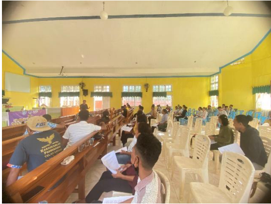
Gambar 1. Penyampaian materi tentang berkhotbah

memperkenalkan lagu baru. Praktik ini berkontribusi pada monotonnya ibadah dan tidak mendukung secara optimal penyampaian pesan khotbah