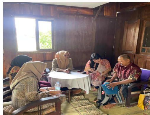
Gambar 1. Tahap Identifikasi

Kegiatan pengabdian masyarakat ini difokuskan pada peningkatan kesadaran pajak, khususnya di kalangan wajib pajak orang pribadi. Tahap awal kegiatan ini melibatkan pembentukan tim pelaksana yang terdiri dari dosen pembimbing dan mahasiswa, serta berkolaborasi dengan asosiasi UMKM dan komunitas lokal. Kemudian pada minggu pertama dilaksanakan survey lokasi, pada tahap ini dilakukan identifikasi jenis UMKM apa yang sudah dimiliki masyarakat, dan apa saja kendala yang dialami selama ini serta juga pengumpulan data potensi desa dan peran serta