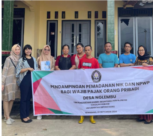
Gambar 3. Dokumentasi Peserta PkM

pajak orang pribadi menyatakan niat untuk melaporkan pajak secara rutin.